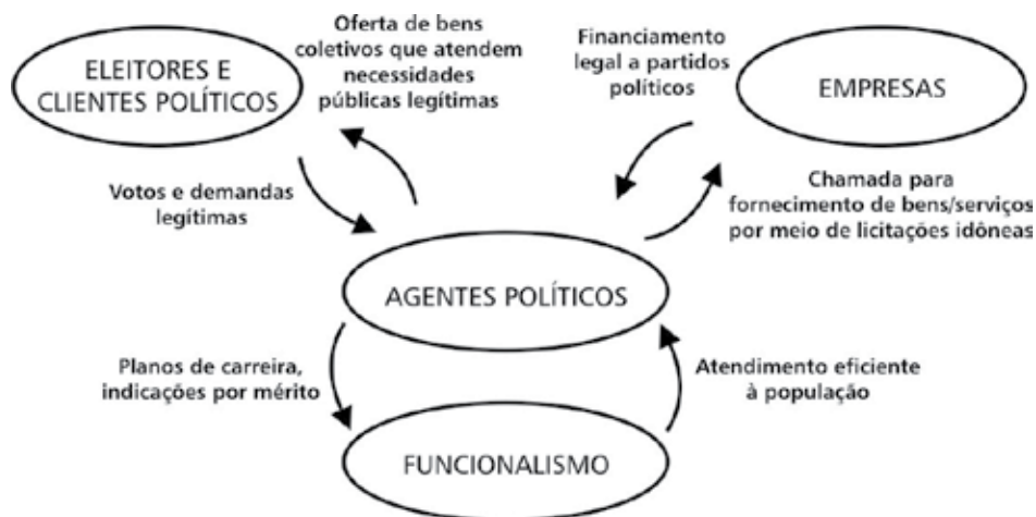
FIGURA 1: Círculo virtuoso de interações.

Os agentes políticos – em geral eleitos, mas que também podem ser doutrinariamente considerados o alto escalão dos poderes executivo e judiciário: secretários, ministros e magistrados graduados – interagem com as outras três entidades: