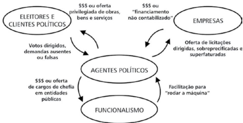
FIGURA 2: Círculo distorcido de interações.

Determinados agentes políticos deturpam a definição das necessidades públicas, barganhando ou empurrando aos eleitores e clientes políticos a oferta de bens coletivos que não correspondem às necessidades públicas reais, bem como oferecendo acesso privilegiado a esses bens coletivos (segurança, saúde, educação, lazer, infraestrutura, crédito) e mesmo dinheiro em troca de apoio. A maioria dos eleitores e clientes políticos, dispersos e alienados, não se dá conta de que a oferta desses bens atende somente a determinados grupos, ou de que estes não estão adequadamente situados e dimensionados, deixando-se manipular e sequer se articulando para apresentar demandas. Uma minoria está diretamente interessada na distorção, para ter acesso privilegiado à margem de um processo político legítimo. Além disso, objetiva-se permitir o direcionamento do fornecimento desses bens e serviços, que na sua concep-