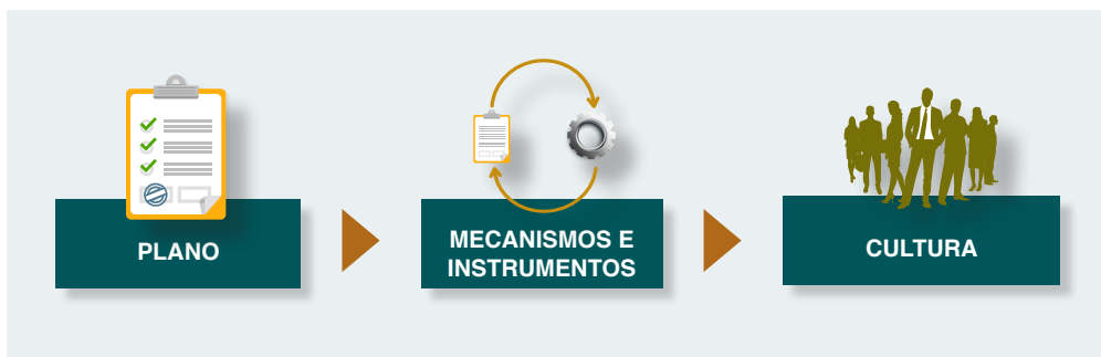
FIGURA 2 – ETAPAS DO PROGRAMA DE INTEGRIDADE

gridade; (ii) monitoramento e aperfeiçoamento dos instrumentos e mecanismos de integridade; (iii) formação e manutenção de uma cultura de integridade. A Figura 2 descreve tais etapas.